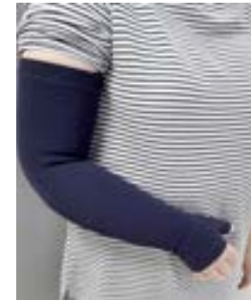
Modèles de contention pour les membres supérieurs et inférieurs

Vous trouverez des vidéos expliquant les aides à la pose de votre bas de compression sur notre chaîne youtube ( youtube.chuclnamur.be ) ainsi que des fiches explicatives sur notre site web ( chuclnamur.be/services/centre-de-referance-du-lymphoedeme ).