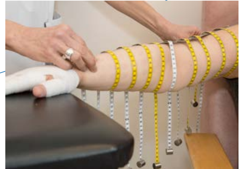
Mesures périmétriques du membre supérieur