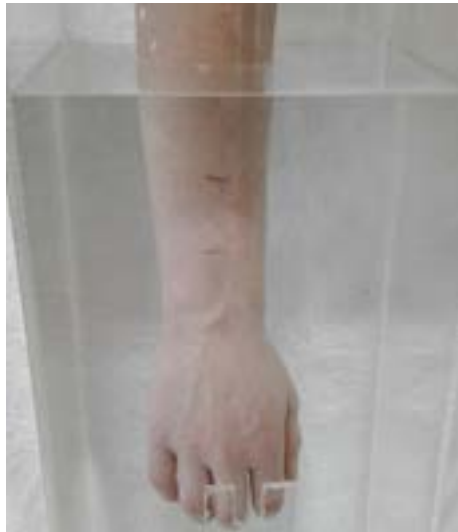
Volumétrie aqueuse numérisée dérivée du principe d'Archimède : main et poignet – pied et cheville