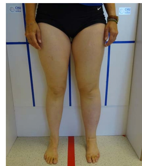
Lymphoedème secondaire unilatéral membre inférieur gauche