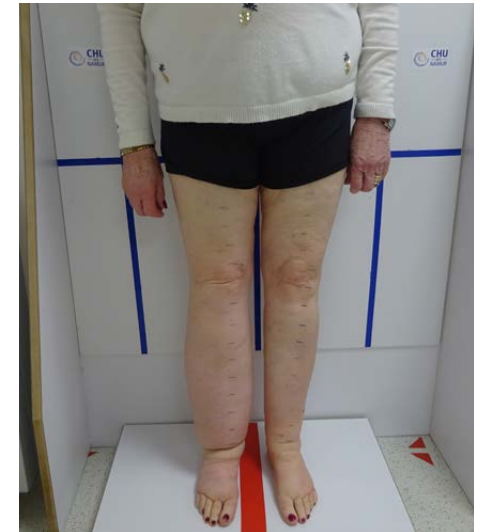
Photo standard membre inférieur