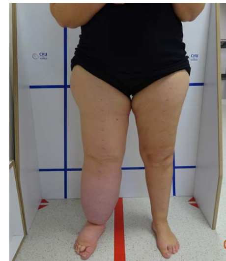
Lymphoedème unilatéral primaire membre inférieur droit