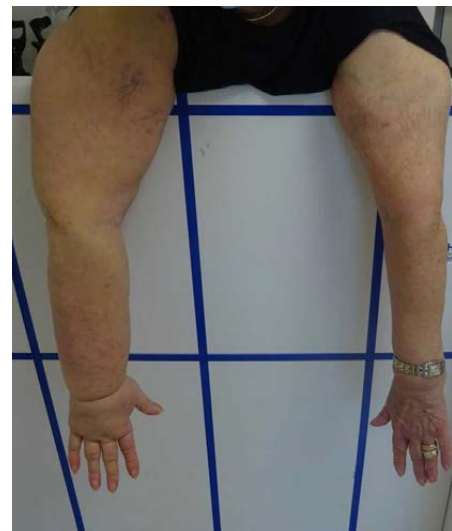
Lymphoedème unilatéral primaire membre supérieur droit

Le lymphoedème représente donc un problème invalidant nécessitant un traitement approprié.