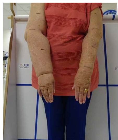
Lymphoedème secondaire unilatéral membre supérieur droit