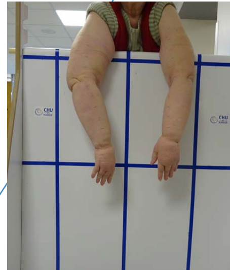
Photo standard membre supérieur