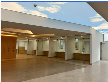
Phase 1 : reconditionnement accueil

Le reconditionnement de l'entrée et de l'accès vers l'accueil central, l'installation d'une nouvelle zone commerciale, l'organisation de bureaux administratifs et la création d'un local pour le service interne de gardiennage seront au cœur de ces nouveaux aménagements.